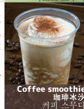
Coffee smoothie 珈琲冰沙 커피 스무디