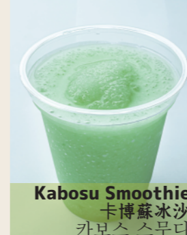
Kabusu Smoothie 卡博蘇冰沙 카보스 스무디