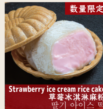
Strawberry ice cream rice cake 草莓冰淇淋麻粉 딸기 아이스떡